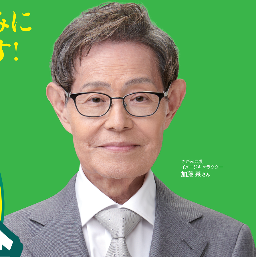
さがみ典礼 イメージキャラクター 加藤 茶さん